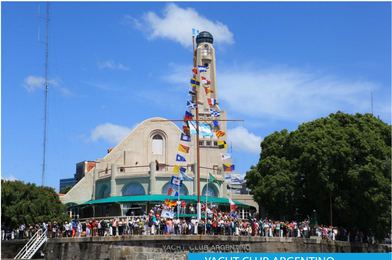
YACHT CLUB ARGENTINO